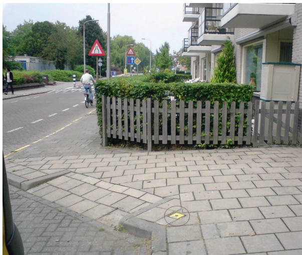
Peilbuis in stedelijk gebied.

vaak volstaan met een geringe peilbuisdichtheid. In bebouwd gebied is over het algemeen een hogere dichtheid gewenst. De achterliggende gedachte hierbij is dat een hoge peilbuisdichtheid gewenst is in deelgebieden waar meer kans is op grondwateroverlast. Bij een zelfde hoge grondwaterstand kan bij woningen bijvoorbeeld overlast worden ervaren, maar op bedrijventerreinen of (stedelijke) groengebieden niet.