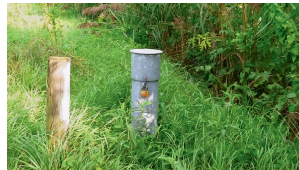
Bovengronds afgewerkte peilbuis; foute locatie-keuze doordat de peilbuis te dicht bij een sloot staat.

Het is ook mogelijk dataloggers te installeren met een voorziening om de meetgegevens telemetrisch, op afstand, uit te lezen. Bij het verzamelen van basisgegevens over de grondwatersituatie in een gebied wegen de voordelen van een dergelijk systeem echter (nog) niet op tegen de nadelen. De investeringskosten zijn per meetpunt fors hoger, circa een factor 3. De ervaring leert verder dat de meetwaarden van dataloggers soms afwijken van de werkelijke grondwaterstanden. Daarom is het verstandig de met de dataloggers geregistreerde meetwaarden minimaal één keer per jaar in elke peilbuis met een handmeting te verifiëren. Het gebruik van telemetrische systemen ontslaat de gebruiker