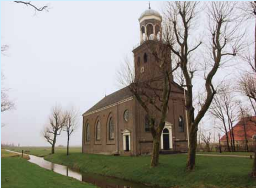
Het aanzicht van de kerk.

en ingepakt met een waterdoorlatend geotextiel. De infiltratieleiding is zoveel mogelijk direct langs de gevels aangebracht, tot circa tien centimeter beneden het niveau van het bovenste funderingshout. Op deze manier ontstaat een direct hydraulisch contact tussen de infiltratieleiding en de paalfunderingen. Bij de woningen zijn de leidingen aan de buitenzijde aangebracht. De kerk staat op een verhoging en heeft een diepe kruipruimte. Daarom zijn de leidingen daar in de kruipruimte ingegraven. De grondwaterstand wordt op de juiste hoogte gehouden door een pompsysteem met aan- en uitslagpeilen. Het systeem bestaat uit een pompput die een open verbinding heeft met het oppervlaktewater. Vanuit de pompput wordt het water verpompt naar een bufferput. Deze put heeft een open verbinding met de infiltratieleidingen. In de bufferput zitten sensoren voor