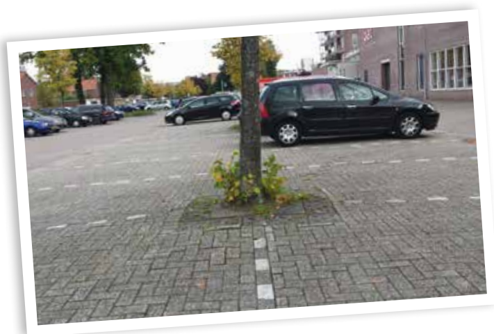
◀ Voorbeeld van een slechte groeiplaats.

Bij het concept klimaatboom wordt het regenwater opgeslagen in een ondergrondse waterbuffer, bijvoor-